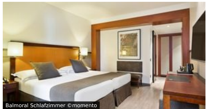
Balmoral Schlafzimmer

Lage & Ausstattung: Im Herzen der Stadt gelegen, ist das Hotel Balmoral, ideal, um Barcelona zu erkunden. Ganz in der Nähe des Passeig de Gracia und Gaudís Casa Milà, ist es auch nur ein kurzer Fußweg zur Rambla de Catalunya. Von hier lässt sich der Innenstadtbereich gut erkunden. Tauchen Sie ein in das quirlige Leben der katalonischen Metropole. Das Hotel ist sehr beliebt und verfügt über eine Sonnenterrasse, einen Frühstücksraum und einen kleinen Fitnessbereich.