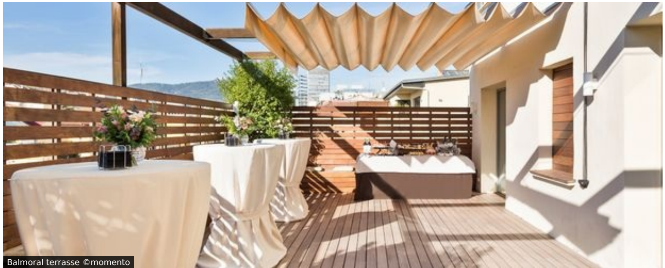
Balmoral terrasse