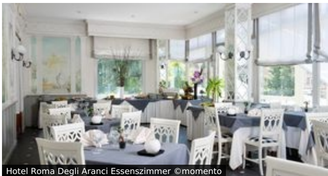
Hotel Roma Degli Aranci Essenzimmer