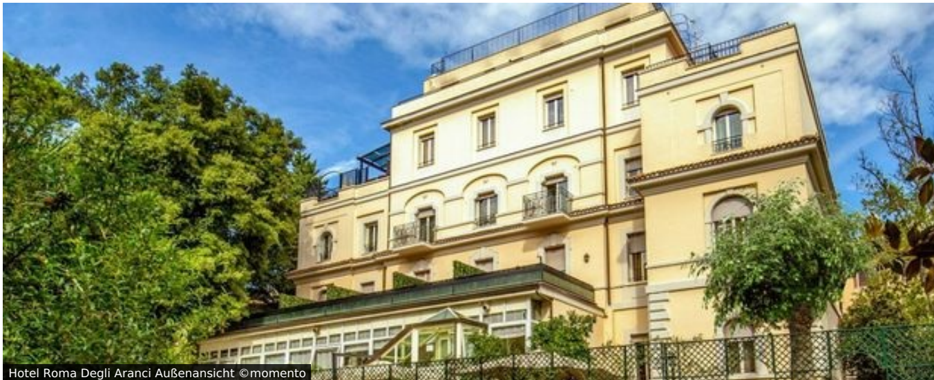
Hotel Roma Degli Aranci Außenansicht