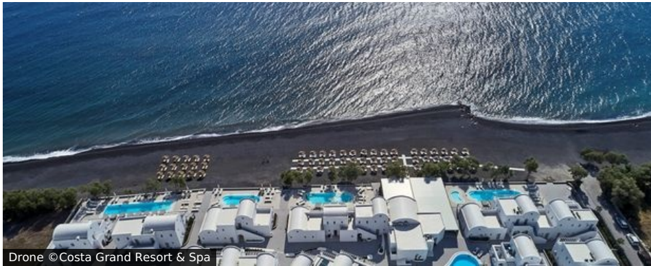
Drone ©Costa Grand Resort &amp; Spa